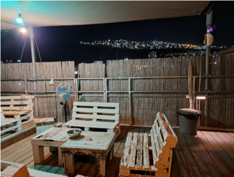
Blick von der Dachterrasse des Tiberias Hostel