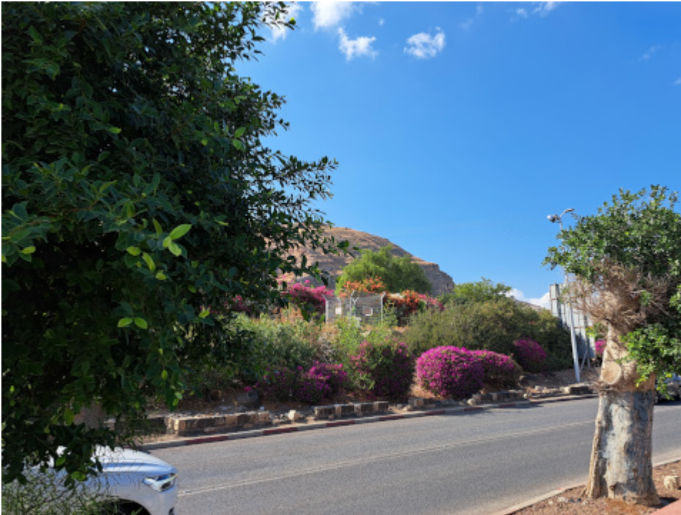
Straßenbegleitgrün in Tiberias

And now for something completely different. Man kann das auch so formulieren: Ein Milchmann trifft sich mit einer Chinesisch sprechenden Lesbe zum Essen. Das ist ja schlimm, und alle müssen sich aufregen (Chor im Hintergrund: Kontaktschuldig! Kontaktschuldig!)