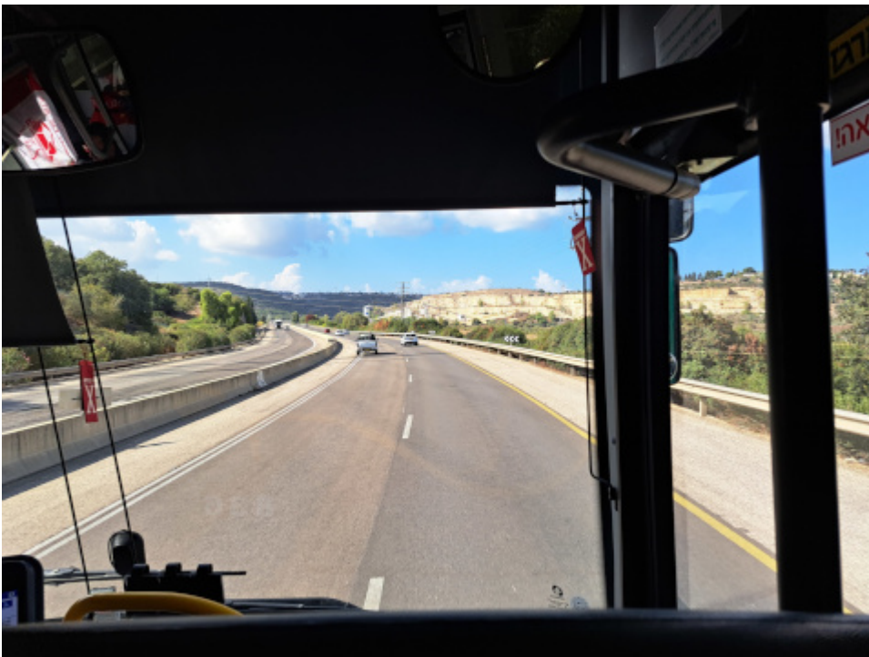
Auf der Strecke von Tiberias nach Tel Aviv

„Guns save lives. We see it time after time“, sagte einer der üblichen Verdächtigen. „I will continue with my policy of distributing weapons everywhere, both to emergency response teams and civilians“. Das ist in Deutschland „rechts“. Früher war das revolutionär und links. O tempora, o mores.