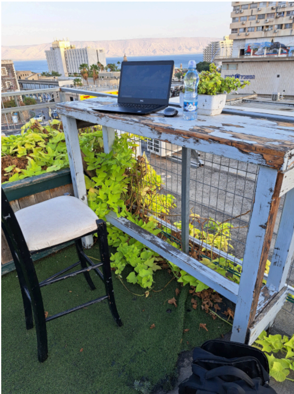
Mein Arbeitsplatz im Tiberias Hostel

Die zweite Garnitur der Fotos meiner Reise nach Israel, garniert mit einem partiischen Blick in das Weltgeschehen und die bürgerliche Presse.