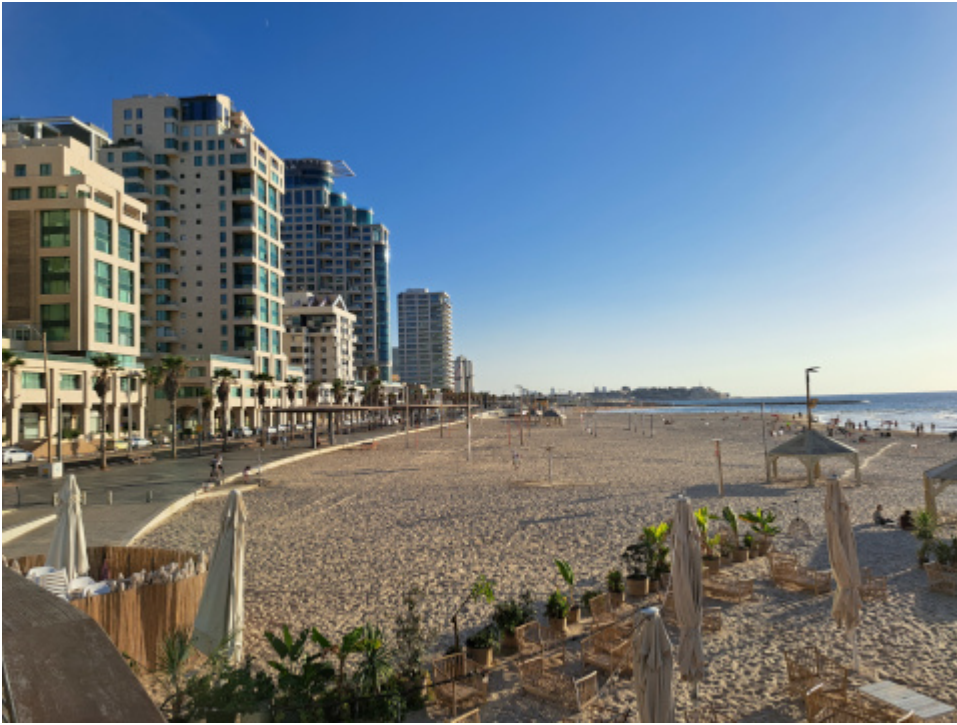
Tel Aviv am 20.20.2023

And now for something completely different. Die Russen gewinnen .