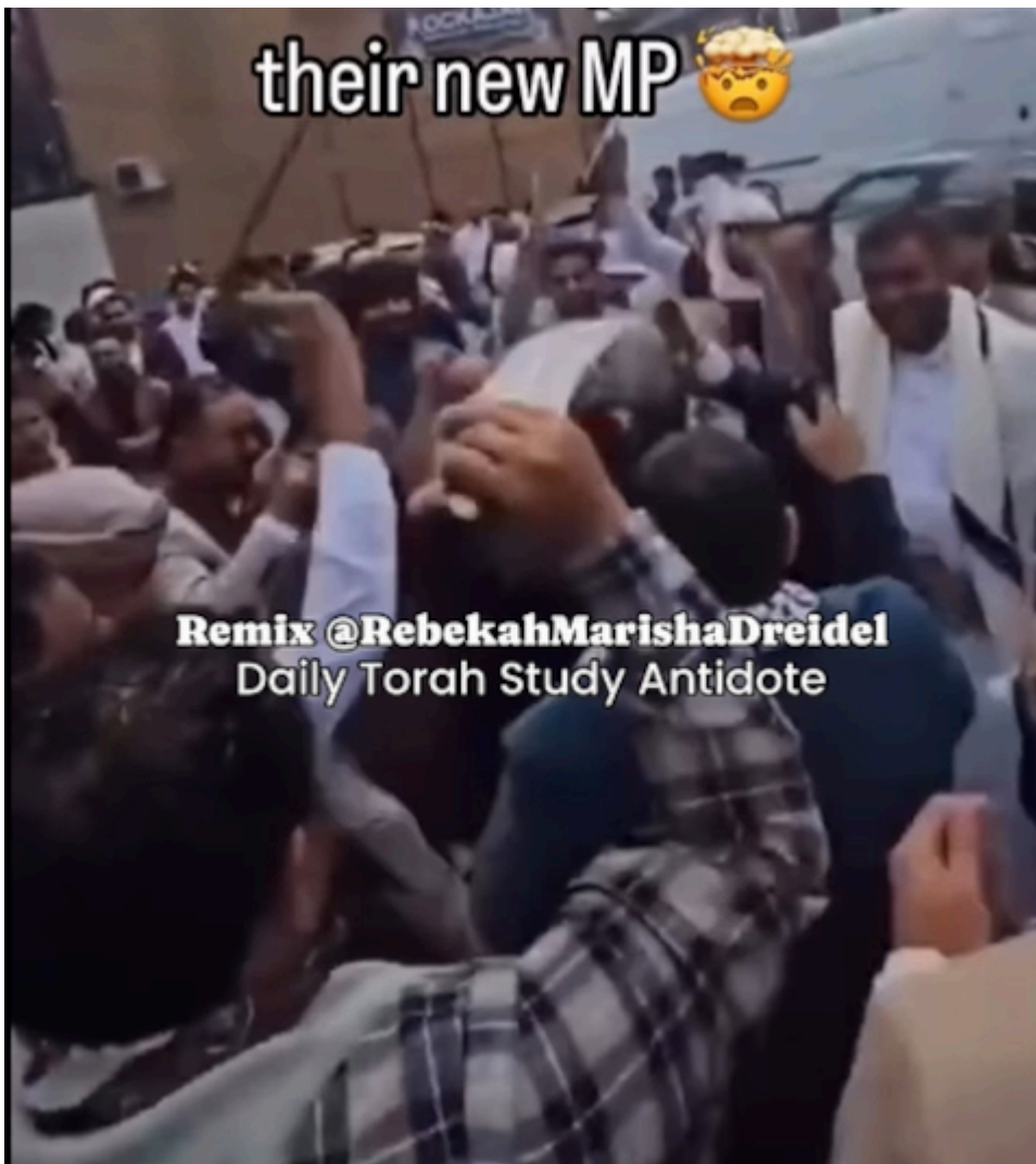
Die englische „Linke“ feiert mit Messern, 2024

Das ist nur eingeschränkt wahr: Labour hat erklärte Israelhasser aufgestellt . Wer „Gaza“ unterstützt, unterstützt die Hamas. Mehr muss man dazu nicht sagen.