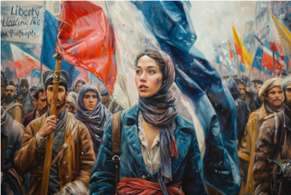
Die französische „Linke“ feiert, 2024, Symbolbild

Lechts und links: Das ist im befreundeten Ausland schwer zu entscheiden. Das Publikum erwartet, dass ich zu den neuesten Wahlen etwas schreibe?