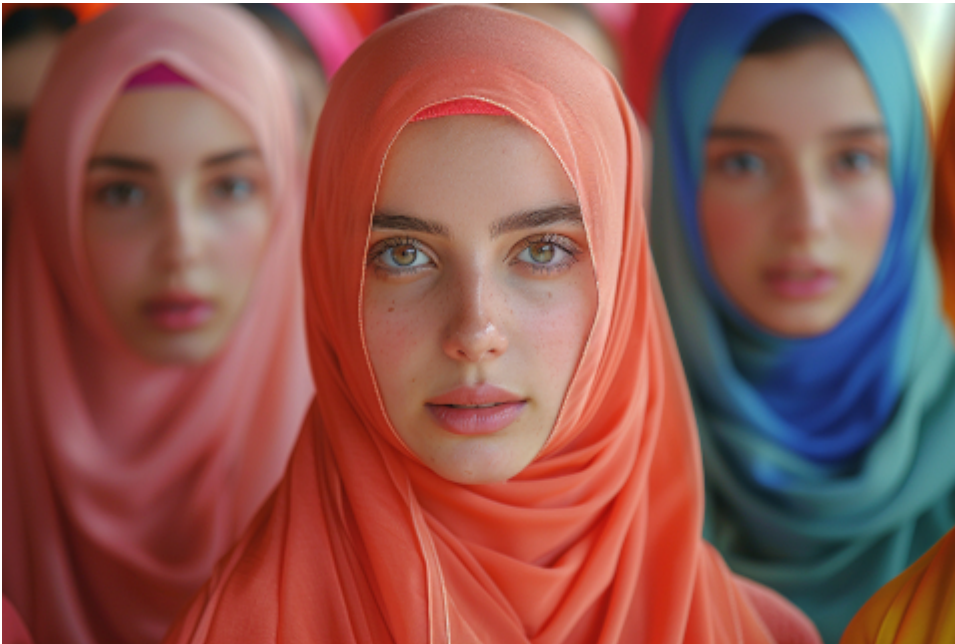
Berliner Schüler der Zukunft (Symbolbild)

Der bürgerlichen Presse entnehme ich: „An Berliner Schulen nehmen religiöse Konflikte mit fundamentalistisch gesinnten Muslimen zu. Lehrer berichten von Druck auf Mitschüler, die sich nicht „islamkonform“ verhalten. Auch wollten Jugendliche während des Unterrichts zu geschlechtergetrennten Gruppengebete. (...)“