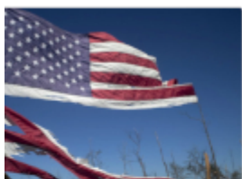
US-Bürgerkrieg? id des Chaos an der ohen Grenze nun eine efahr

Der Flick-Skandal hat vorgeführt, dass die herrschende Klasse alle Parteien gewichtet unterstützt, die ihnen nützlich sein können. Das ist damals nicht anders als heute .