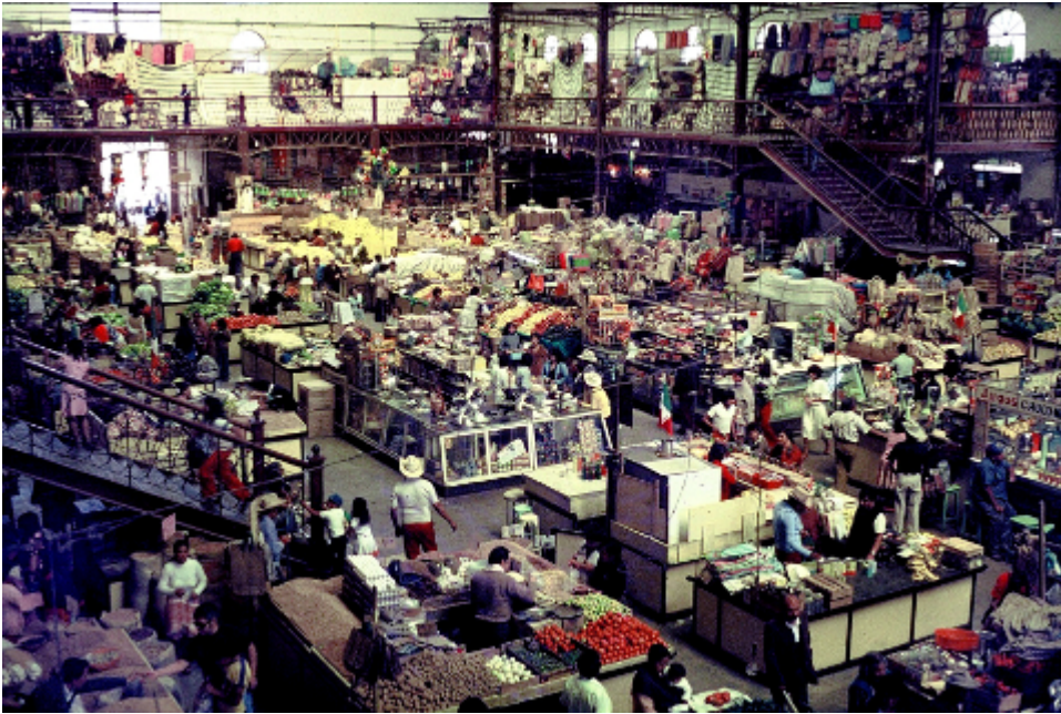
Der Markt von Chapala , Jalisco, Mexiko (1982)