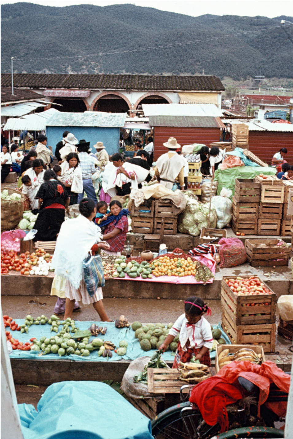
Marktszene in San Cristóbal de las Casas , Mexiko (1981). (Vgl. 12.08.2012 )