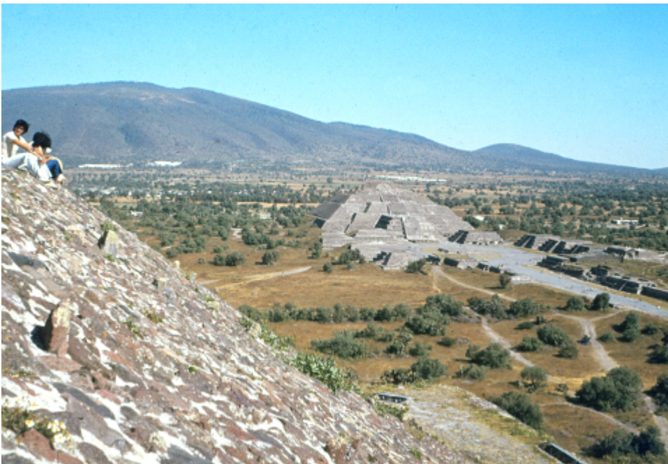
Die Ruinen von Teotihuacán in Mexiko, fotografiert am 07.10.1979.