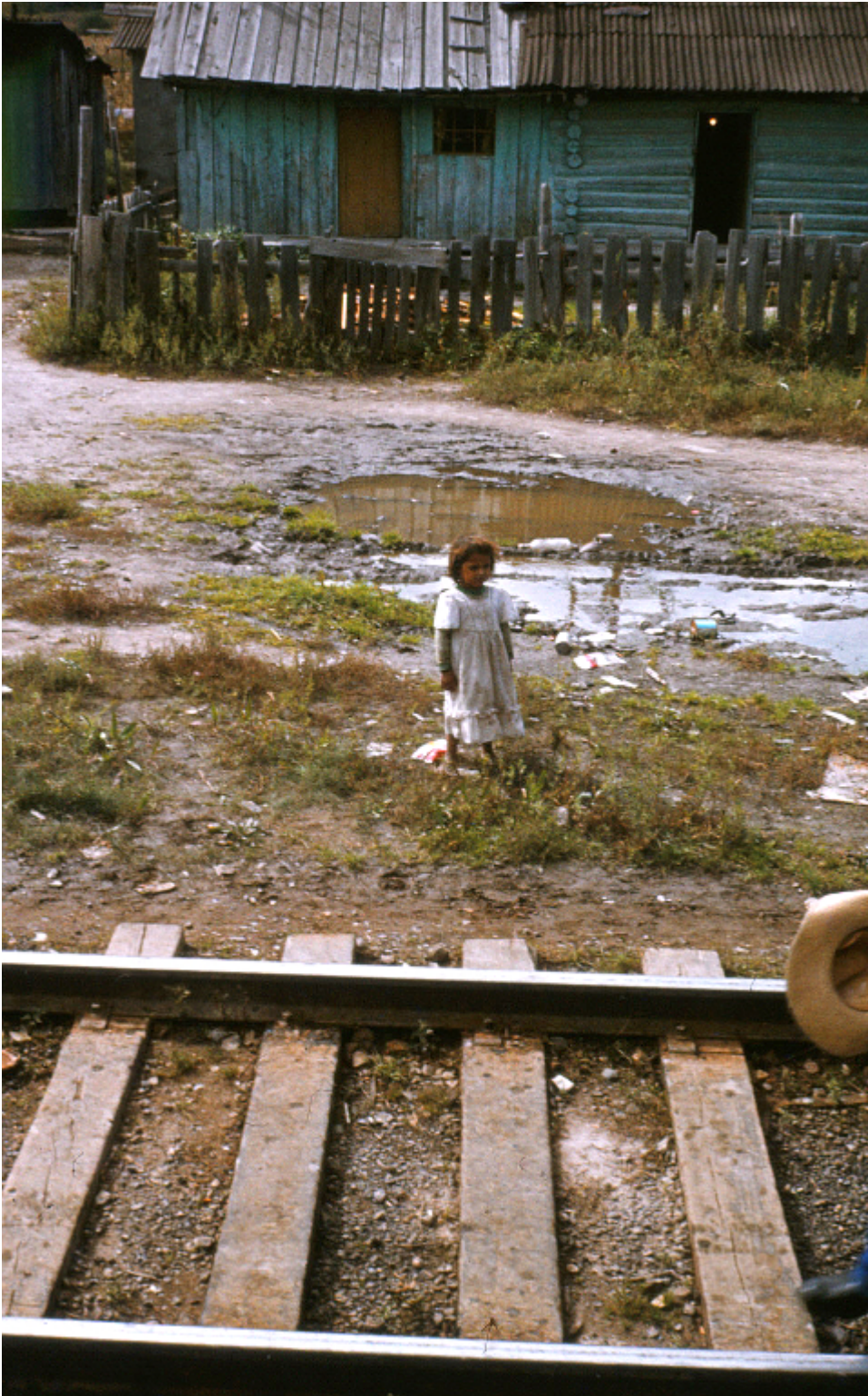
Fotografiert 1981 an irgendeiner Bahnstrecke im Norden Mexikos.