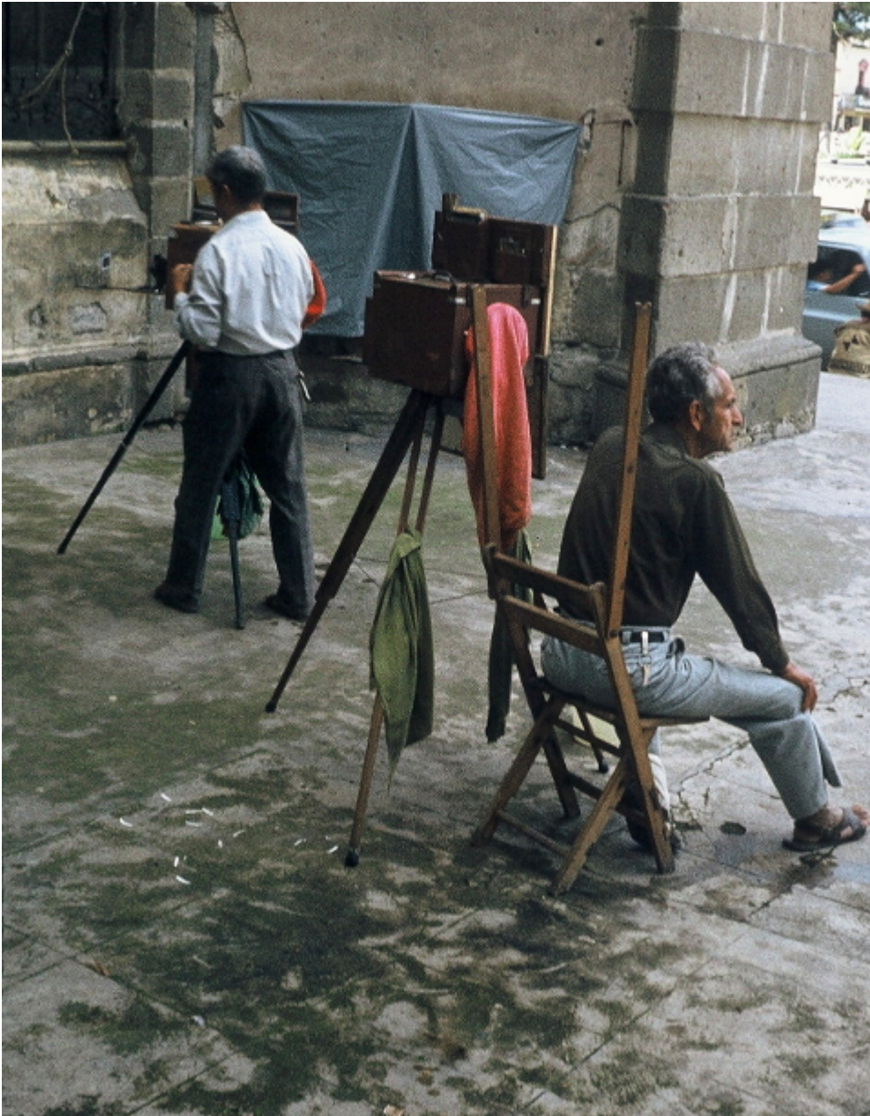
Fotografen in Mexiko Stadt, 1982