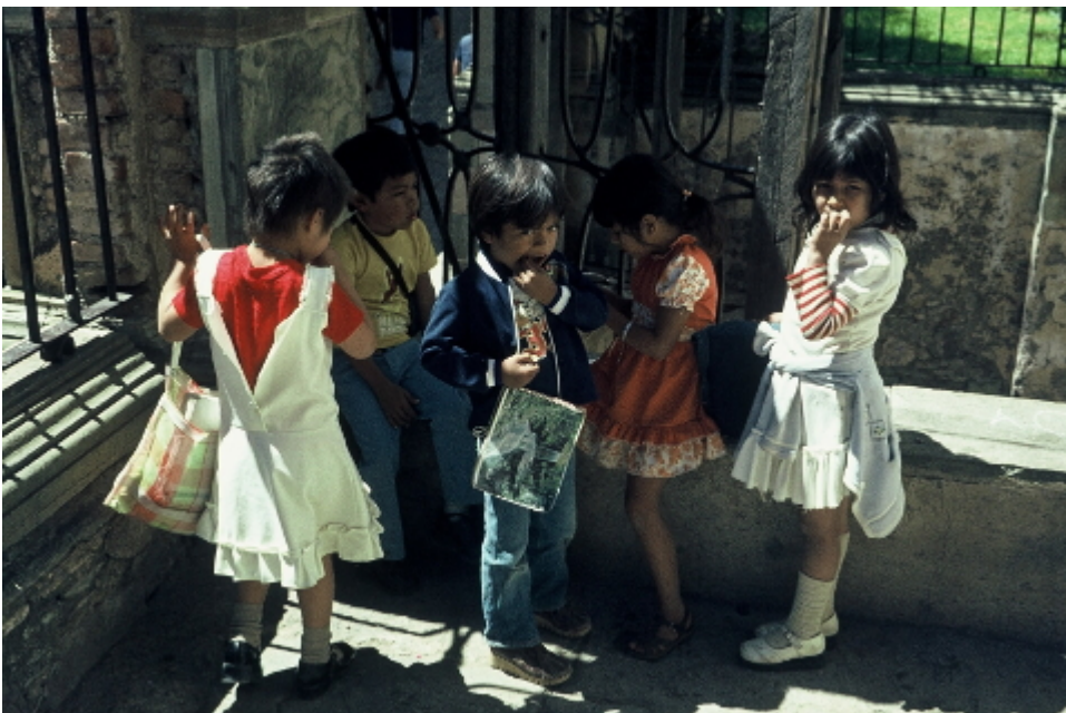
Puebla, Mexiko, 1979