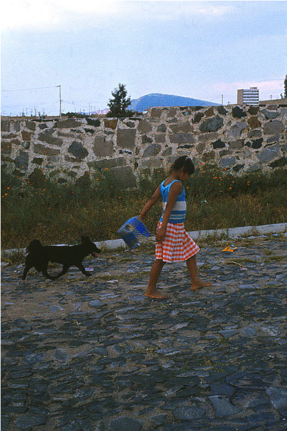
Mädchen mit Hund, Guadalajara (1979)