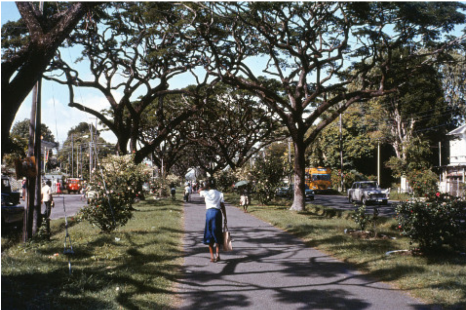
Die Fotos habe ich 1982 in Georgetown, Guyana, gemacht.

Wenn man etwas über Guyana erzählen will, greifen die Gesprächspartner zur nächsten Landkarte. Mittelamerika? Nein, Süd, dort wo die Franzosen ihre Raketen starten? Auch falsch, das ist Französisch-Guyana und Teil Frankreichs. Und Surinam ist das ehemalige holländische Guyana. Wer das vormals britische Guyana kennt, erinnert sich vielleicht an den Massenselbstmord von Jonestown. Nur zum Mitschreiben: Guyana ist das einzige englischsprachige Land Südamerikas. Die