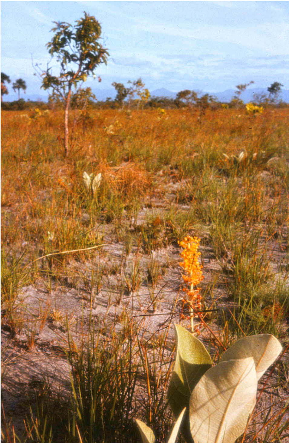
Die Rupununi -Savanne im Westen Guyanas in der Trockenzeit (Symbolbild für regenarme Zeiten)

... Ich vermochte nur wenig. Aber die Herrschenden Saßen ohne mich sicherer, das hoffte ich.