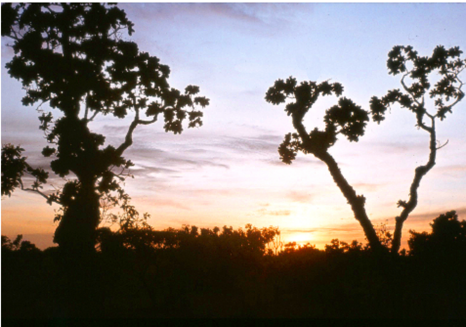
Rupununi bei Abenddämmerung, in der Nähe der Manari-Ranch

Dutch and British colonization made an indelible mark on Guyana, leaving behind a now dilapidated colonial capital, a volatile mix of peoples and a curious political geography. The country's natural attractions, however, are impressive, unspoiled and on a scale that dwarfs human endeavor. Guyana has immense falls, vast tropical rainforest and savanna teeming with wildlife. If the government doesn't destroy the environment in a bid to pay off its huge foreign debt, Guyana could be the eco-tourism destination of the future. Right now, it's the place for independent, rugged, Indiana Jones types who don't mind visiting a country that everybody else thinks is in Africa.