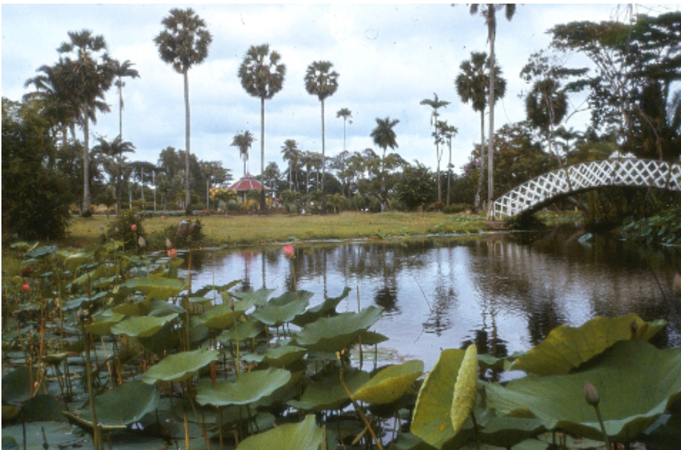
Guyana Zoological Park , 1982