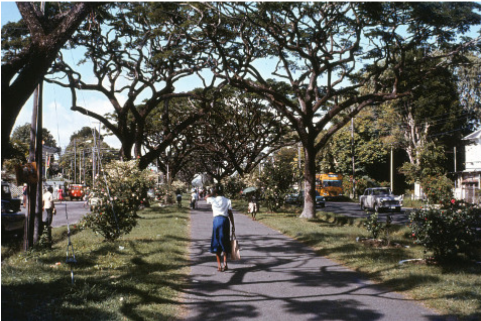
Die Fotos habe ich 1982 in Georgetown, Guyana, gemacht.

Wenn man etwas über Guyana erzählen will, greifen die Gesprächspartner zur nächsten Landkarte. Mittelamerika? Nein, Süd, dort wo die Franzosen ihre Raketen starten? Auch falsch, das ist Französisch-Guyana und Teil Frankreichs. Und Surinam ist das ehemalige holländische Guyana. Wer das vormals britische Guyana kennt, erinnert sich vielleicht an den Massenselbstmord von Jonestown. Nur zum Mitschreiben: Guyana ist das einzige englischsprachige Land Südamerikas. Die