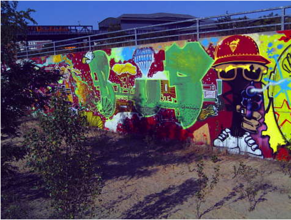
Graffiti am Gleisdreieck