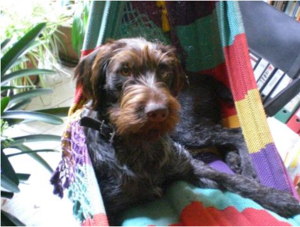
Tölchen aka Ajax vom Teufelslauch in meiner Hängematte aus Tintorero in Venezuela.