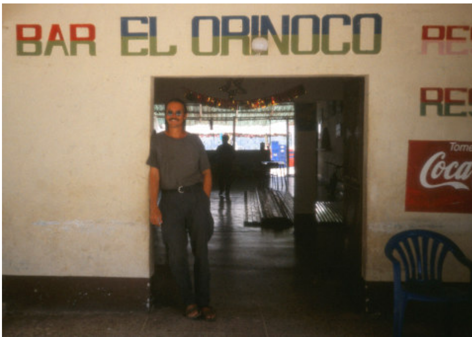
Der Autor in San Fernando de Atabapo

Nacional kann die genauen Standorte auf der Karte zeigen. Wichtige Honoratioren des Ortes sind daran nicht ganz unbeteiligt, und der Schmuggel nach Kolumbien ist ebenfalls einträglich. Übermäßiger Aktivismus der Sicherheitskräfte würden den regen Bootsverkehr nur unnötig stören. Auch die kolumbianischen Grenzposten auf der anderen Seite des Guivare beobachten den Fluß, manchmal. Was gringos tun, interessiert sie nicht. Jede zweite Nacht sind in der Ferne Schußwechsel zu hören. Die Guerilla, sagen die Venezolaner.