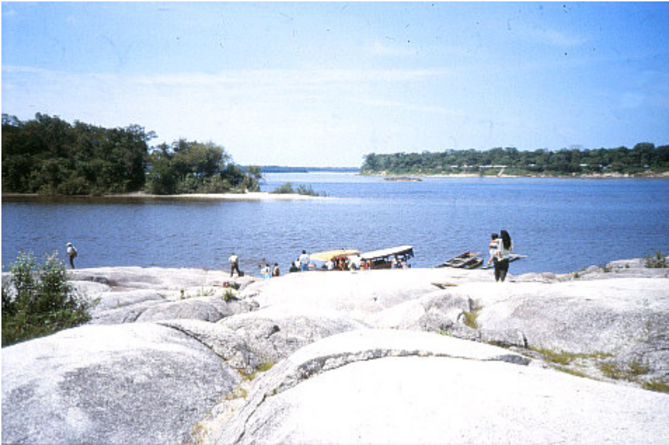
San Fernando de Atabapo im venezolanischen Bundesstaat Amazonas (obwohl der Ort am Orinoco liegt).

Oberhalb der großen Katarakte fanden wir längs des Orinoco auf einer Strecke von 450 km nur drei christliche Niederlassungen, und in denselben waren kaum sechs bis acht Weiße, das heißt Menschen europäischer Abkunft. Es ist nicht zu verwundern, daß ein so ödes Land von jeher der klassische Boden für Sagen und Wundergeschichten war. Hierher versetzten einst Missionare die Völker, die ein Auge auf der Stirn, einen Hundskopf oder den Mund unter dem Magen haben. (Alexander von Humboldt)