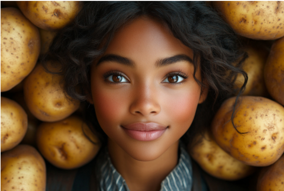
Kamala Harris, so wie die sie Deutschen sehen

Ich muss doch mal ein ernstes Wort mit dem hiesigen Publikum reden. Ein Leser fragt: „Möchte denn der ‚gute Marxist‘ lieber einen Präsidenten in der Rolle eines Trumps oder den Gouverneur of Florida DeSantis?“