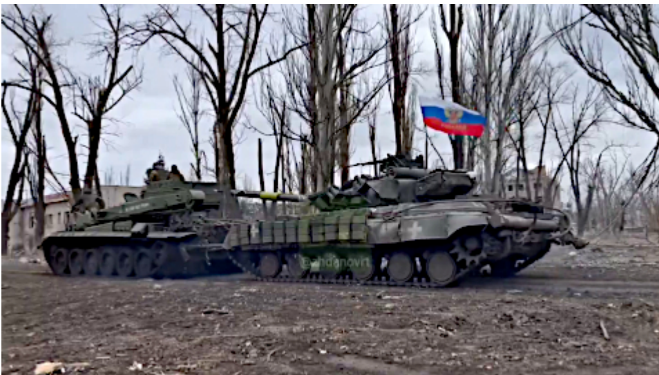
Russische Soldaten schleppen einen erbeuteten Panzer der ukrainischen Streitkräfte aus Avdeevka ab.

Berliner Zeitung : „Polens Außenminister: Soldaten aus Nato-Ländern sind bereits in der Ukraine“.