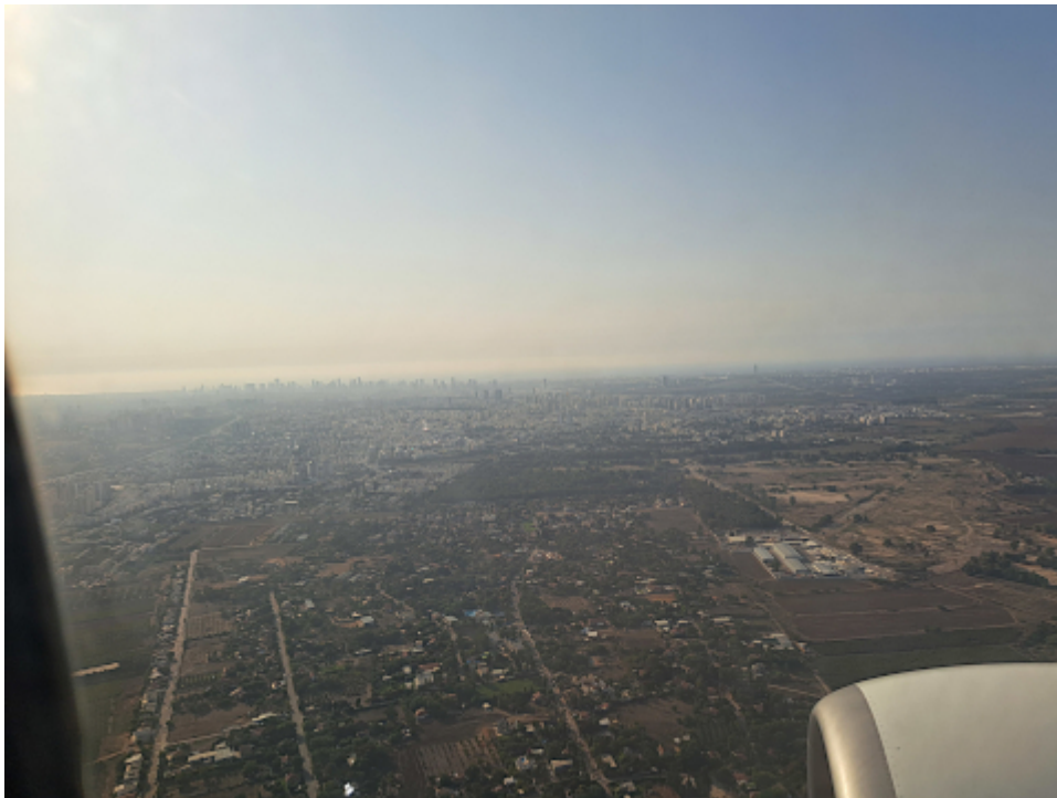
Anflug auf Tel Aviv, 08.10.2023, 15:15 Uhr