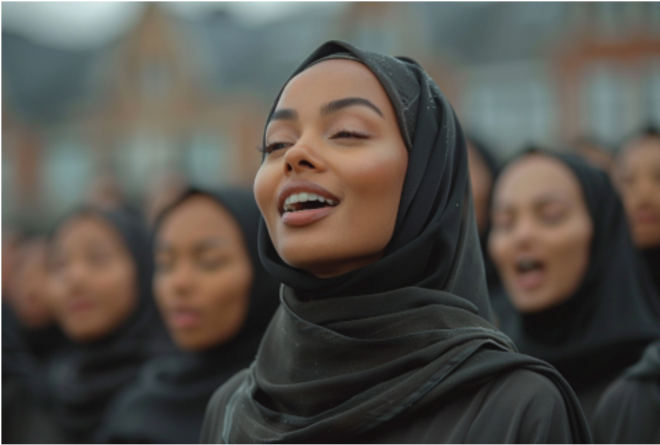
Berlin-Kreuzberg, Karneval der Kulturen, Mitglieder der Grüninnen, 2030 (Symbolbild)

– Wulff lobt Ramadan-Beleuchtung – „Dann kann man auch mal ein muslimisches Lied singen“. Moment – das hat doch bestimmt etwas mit der Cannabis-Freigabe zu tun? Man könnte das vielleicht mit Preußens Gloria kombinieren. (Ich höre gerade Jingo , das passte überhaupt nicht.)