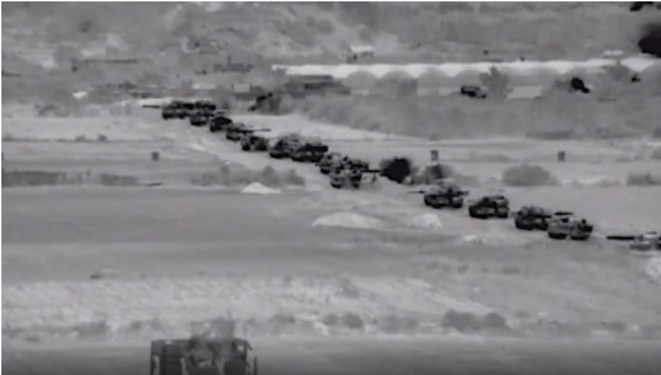
Israelische Panzer im Gaza-Streifen (gestern)

gefesselt und mit verbundenen Augen, vor seinem IS-Henker kniet, der ihm gleich den Kopf abschlagen wird, ist nach der Theorie des Intersektionalismus immer noch Täter und sein islamistischer Henker das Opfer.“ ( Roger Letsch )