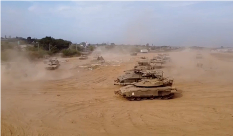
Israelische Panzer im Gaza-Streifen (gestern)

Die so genannten Palästinenser wollen auch halb Jerusalem zurück. Mit weniger würden sie sich nicht zufriedengeben. Wer aber denkt, dass Israel auch nur einen Quadratmeter Jerusalems abgeben [wem eigentlich?] aufgeben würde, der sollte zum Psychiater gehen. In welcher Traumwelt leben diese „Zwei-Staaten“-Befürworter eigentlich?