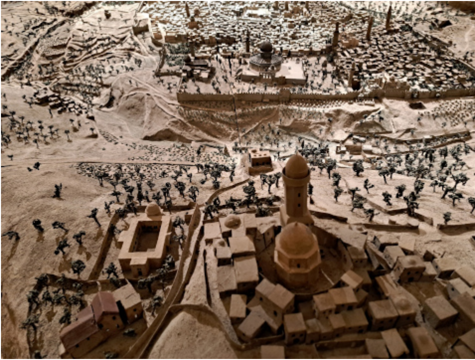
Modell Jerusalems im 19. Jahrhundert. Davidsturm Museum

Die jordanischen Streitkräfte gehen entlang der Grenze zu Israel in Stellung , um zu verhindern, dass sich ein Mob von muslimischen Randalierern der Grenze nähert und möglicherweise versucht, nach Israel zu gelangen.