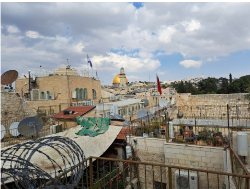
Jerusalem, Blick zur Klagemauer

IDF (Instagram) : „THIS is what the world needs to know about the civilians in Gaza“.