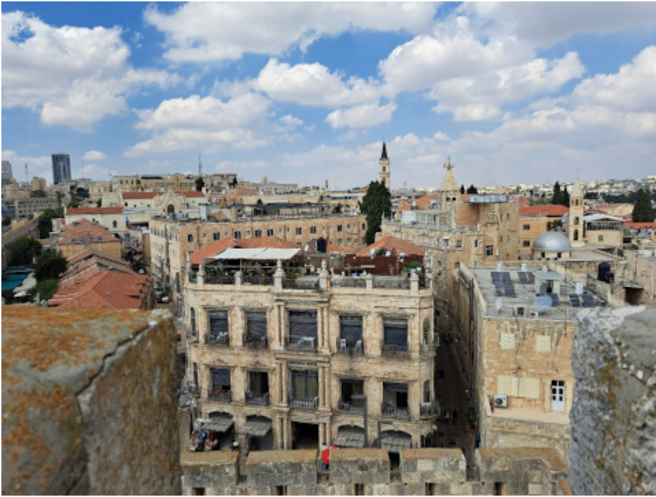
Jerusalem, Blick vom Davidsturm nach Norden zum christlichen Viertel der Altstadt, im Vordergrund das New Imperial Hotel .

Washington Post : „Video shows apparent death of Israeli hostages in Hamas custody“.