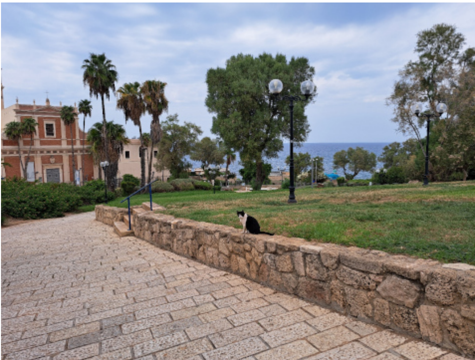
Old Jaffa und die Katze sagte □□□□.

Ich war heute der einzige Tourist in Old Jaffa und konnte ungestört fotografieren. Ich werde in der übernächsten Woche noch mal hier sein und auch Nachtfotos machen. Ich musste mir erst einen Überblick verschaffen, wie und wo man hier mit dem Bus fährt. Es ist komfortabel und kinderleicht und die Busse sind alle klimatisiert. Es kriege es aber noch nicht hin, ein Fahrrad zu entsperren. Das erledige ich asap.