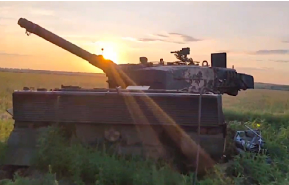
Zerstörter Leopard 2 in der Ukraine