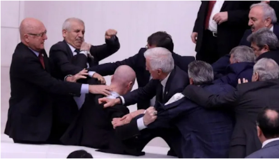
Türkische Männer, deren Söhne und Enkel in Deutschland Fußball spielen ( Symbolbild )

Bezael Smotrich ist zum Thema wie gewohnt Trump-mäßig unterwegs . Übrigens: Israel verurteilt Israelis wegen rassistisch motivierter Gewalt.