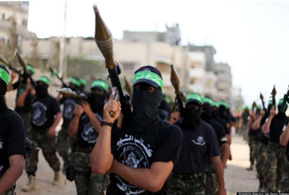
Izz al-Din al-Qassam Brigaden der Hamas

„ US-Geheimdienste schätzen , dass die Ukraine ein zentrales Ziel ihrer Offensive verfehlen wird.“ Ich schätze die Lage als Experte ein, falls das jemand wissen will, aber nur per verschlüsselter E-Mail. Oder hier auf dem Blog.