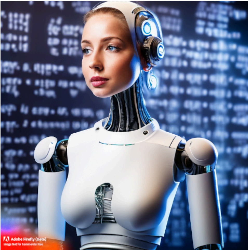
beautiful female roboter thinking about a mathematical problem, background matrix, ultrarealistic (Adobe)

Ich habe mir ein Heise-Lehrvideo über KI in Adobe Photoshop angesehen. Ich nutze Photoshop nicht, weil ich für Software kein Geld ausbebe, sondern Gimp , was für meinen Bedarf völlig ausreicht – obwohl für Neulinge etwas gewöhnungsbedürftig, was die Usability angeht. (Das Video kann ich empfehlen, trotz der Werbung: Man amüsiert sich, und der conclusio stimme ich zu.)