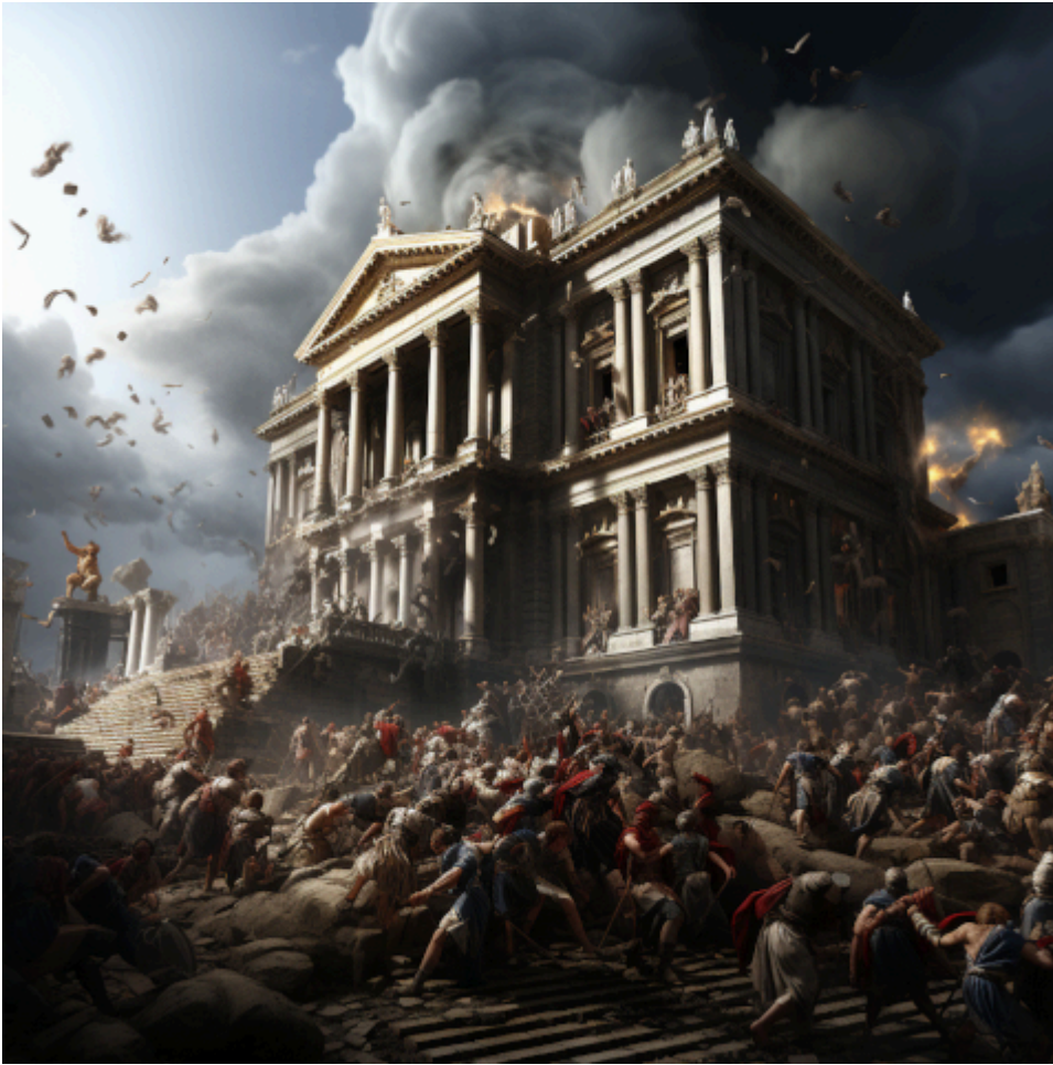
Wars of the Diadochi -chaos 100 -s 750

Meine erste Idee war: Vermutlich hat Erdogan Putin den Rat gegeben, so einen dilettantischen „Putsch“ zu inszenieren, damit er seine innenpolitischen Gegner los wird. Genialer Schachzug.