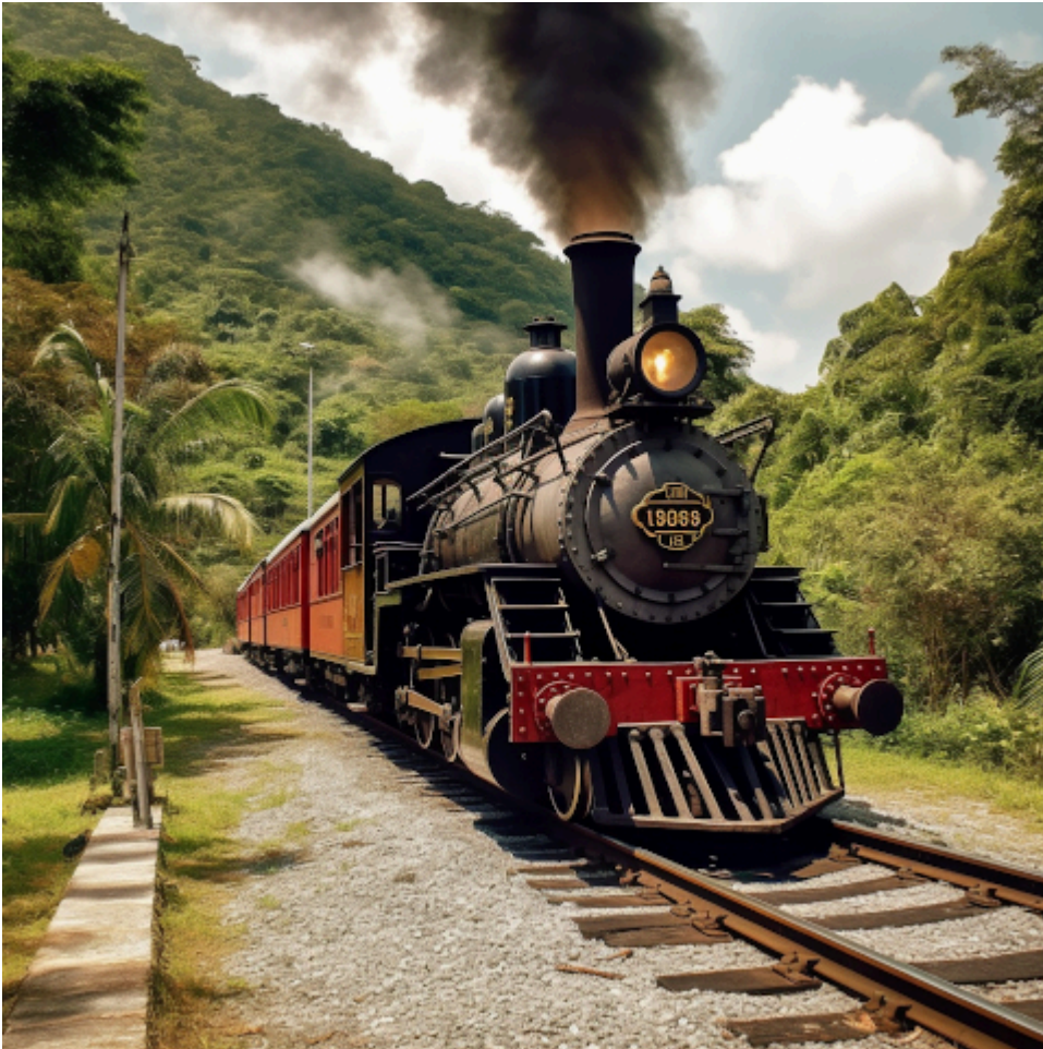
/imagine railway line Guayaquil Duran steam locomotive ecuador

Verständlich, dass eine schöne Dampflok schnell gemacht werden kann. Aber wo ist Ecuador? Vermutlich soll das durch die Palmen und das wuchernde Grünzeug suggeriert werden. Es sieht auch so aus, als führe der Zug gerade von einem Abstellgleis los. Ich müsste mir eine intelligentere Eingabe ausdenken und bessere Parameter , von denen schon der Terminator sprach.