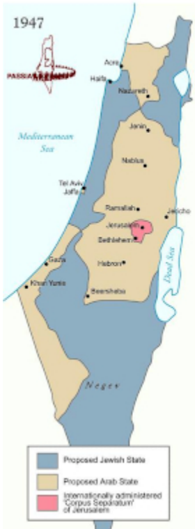
1947: United Nations Partition Plan