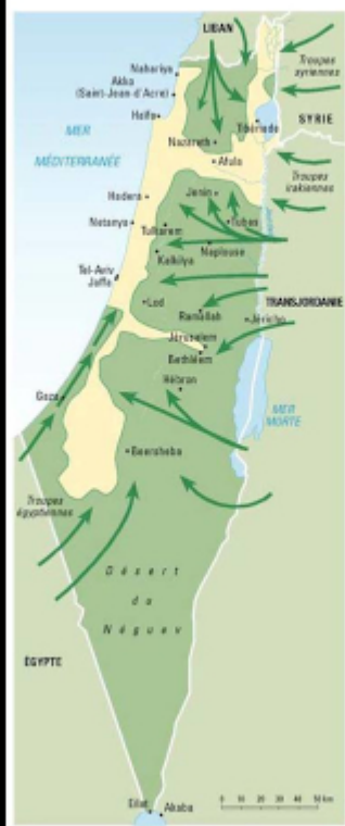
June 1948: Arab armies invade