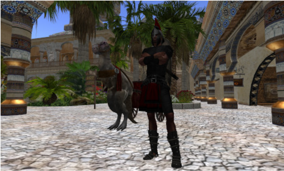
Virtueller Krieger auf Gor, mit einem virtuellen Streitwagen samt virtuellem Zugtier