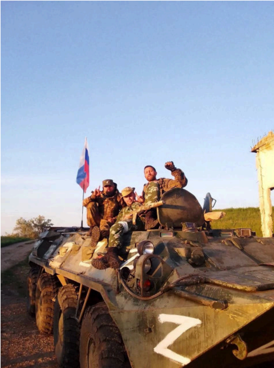
Östliche Werte (Symbolbild)

And now for something completely different.