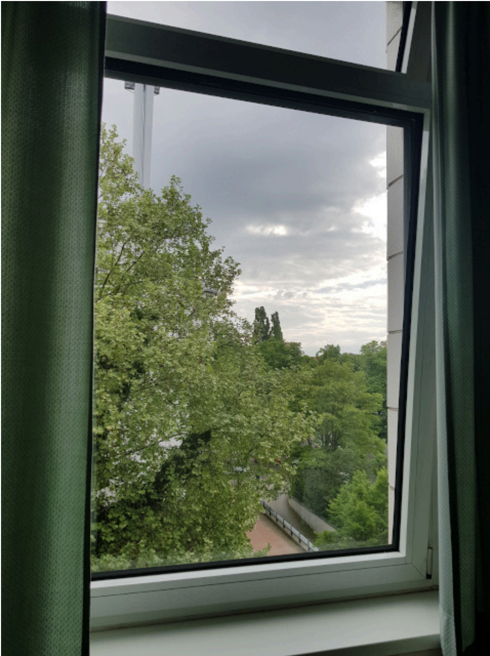
Meine temporäre beschränkte Weltsicht, ohne Krankenschwester (Symbolbild)

Wahlergebnisse? Sagte hier jemand Wahlergebnisse ? Wer in NRW regiert, wird in 1000 Jahren so wichtig sein wie für uns heute die Schlacht bei Mursa . Oder wie Söldner in der Ukraine kämpfen. Oder wie die Schlacht um Severodonezk .