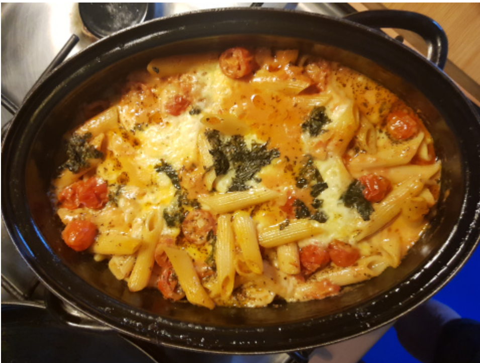
Nudelauf mit Mozzarella und Tomaten à la Burks

– Vivantes lässt Streiks vorläufig verbieten . Wundert mich nicht. Wenn das in letzter Instanz aufgehoben werden wird, wird sich niemand mehr daran erinnern. Wie bei meiner Hausdurchsuchung : Das Verfahren ist die Strafe.