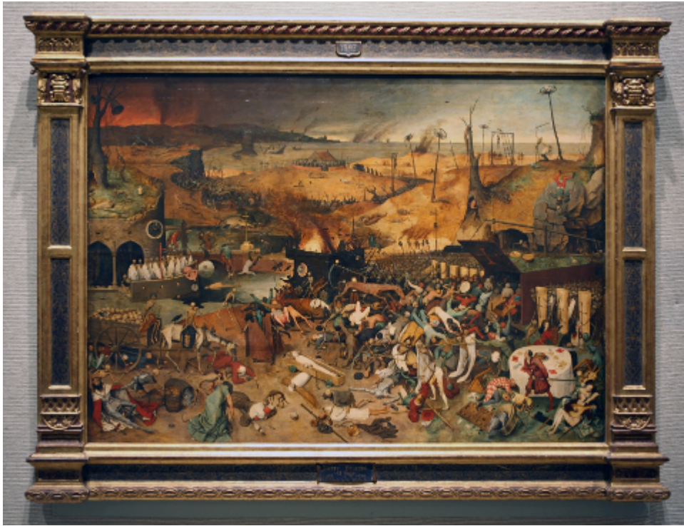
Pieter Bruegel der Ältere: Der Triumph des Todes