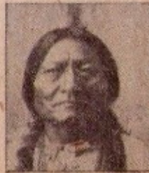
Chief Sitting Bull

Little Big Horn, Sitting Bull escaped to Canada, but returned to the United States after being promised a pardon. He then appeared in Buffalo Bill's Wild West Show, but lately he has been urging the Sioux not to sell their lands.