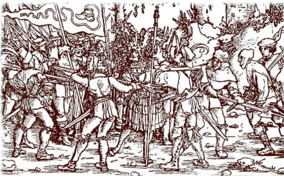
Bild: Revolutionäre Bauern attackieren einen Feudalherrn aka „Ritter“, deutscher Bauernkrieg , 1524-25

Vorsicht! Warnung! Das ist ein anspruchsvoller, dröger und langer Text, der zudem historisches Wissen und die Kenntnis einiger wissenschaftlicher Begriffe voraussetzt!