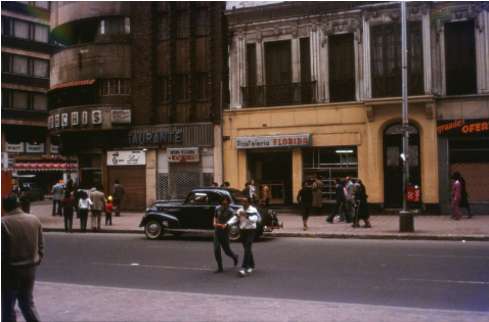
Straßenszenen in Kolumbiens Hauptstadt Bogotá 1982