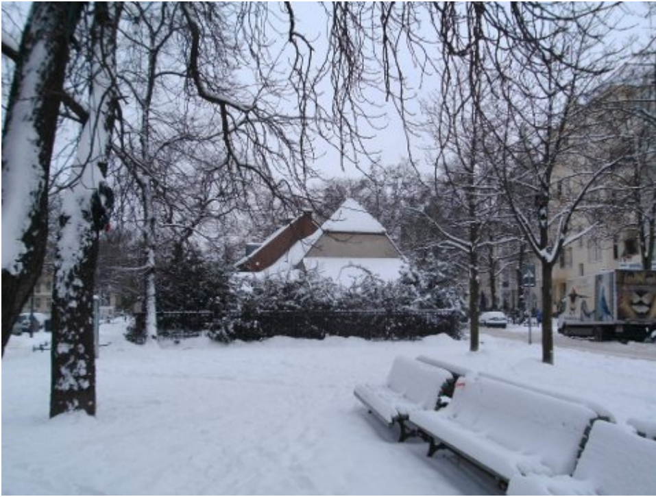
Richardplatz , Rixdorfer Dorfschmiede , zum wiederholten Male..