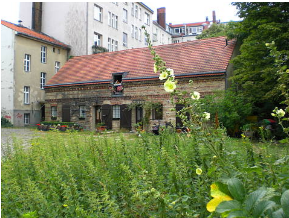
Kirchgasse (oben) und Richardplatz ( Hinterhof )